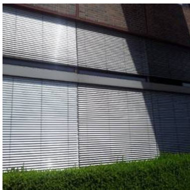
VivaWest GE, Außenraffstore