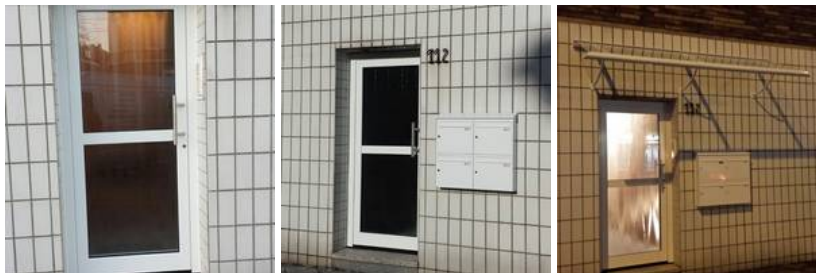
HTA Klauke Serie 480 plus Objekt mit ARIANE - Aluminium-Vordach MENORCA I VSG (Verbund- Sicherheitsglas) und JU Briefkastenanlage Auf Putz (Wandmontage)