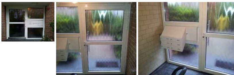
mit Seitenteil, Ornament Chinchilla + 6 mm VSG, 6 x BK schräg abfallend