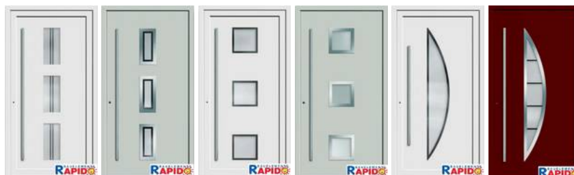
Modell 7745-50 Modell 7745-70 Modell 7746-50 Modell 7746-70 Modell 7747-50 Modell 7747-70 außen mit Edelstahl-Flachrahmen außen mit Edelstahl-Flachrahmen außen mit Edelstahl-Flachrahmen