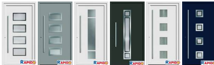
Modell 7750-50 Modell 7750-70 Modell 7742-50 Modell 7742-70 Modell 7743-50 Modell 7743-70 außen mit Edelstahl-Flachrahmen außen mit Edelstahl-Flachrahmen außen mit Edelstahl-Flachrahmen