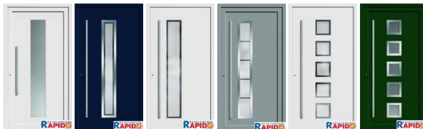
Modell 7740-50 Modell 7740-70 Modell 7740-50 Modell 7741-70 Modell 7744-50 Modell 7744-70 außen mit Edelstahl-Flachrahmen außen mit Edelstahl-Flachrahmen außen mit Edelstahl-Flachrahmen